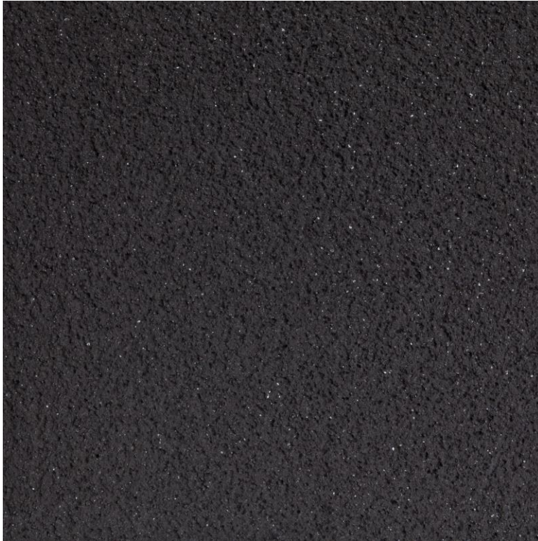
Farbton Life 0883