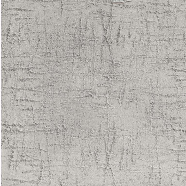
Einlage mit Strukturwalze