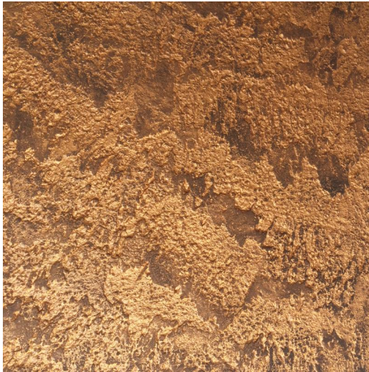
Abbildung Metallic Bronze als Grundfarbton

Bei der Ausführung größerer Fassadenflächen mit Metallicbeschichtungen ist die Applikation mit einem Farbspritzgerät vorzuziehen, um Streifenbildung zu vermeiden.